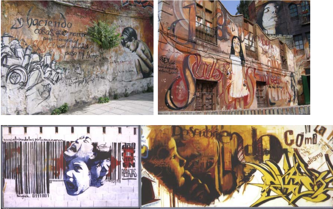
Varias piezas con niños y poesía, SEX/EL NIÑO DE LAS PINTURAS

EL NIÑO y sus obras con los niños tenían tanto popularidad que un grupo conocido como Transmisiones Urbanas junto con el Instituto Andaluz de la Juventud, la Diputación de Granada, y aún el Ayuntamiento de Granada, montó una exposición llamado “Mira los Muros” que consistió en un folleto mostrando al transeúnte una guía de la ciudad a través de las piezas nuevas de EL NIÑO. El artista les dio su permiso. La funda del folleto tenía las palabras “Un paseo por los muros perdidos del centro de la ciudad con EL NIÑO...que invade los espacios públicos, así convertidos en museos vivos de arte actual.” Estas palabras atractivas dicen algo en particular que es muy interesante en el crecimiento de popularidad del graffiti artístico—ellos se lo refieren como “museos vivos.”