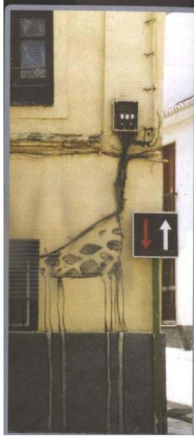
Jirafa, un momento de expresión para SEX, Realejo

que nunca miraría a aquellos cables así. Lo que más me sorprendió fue conocí su artista—nadie más que el mismo SEX.