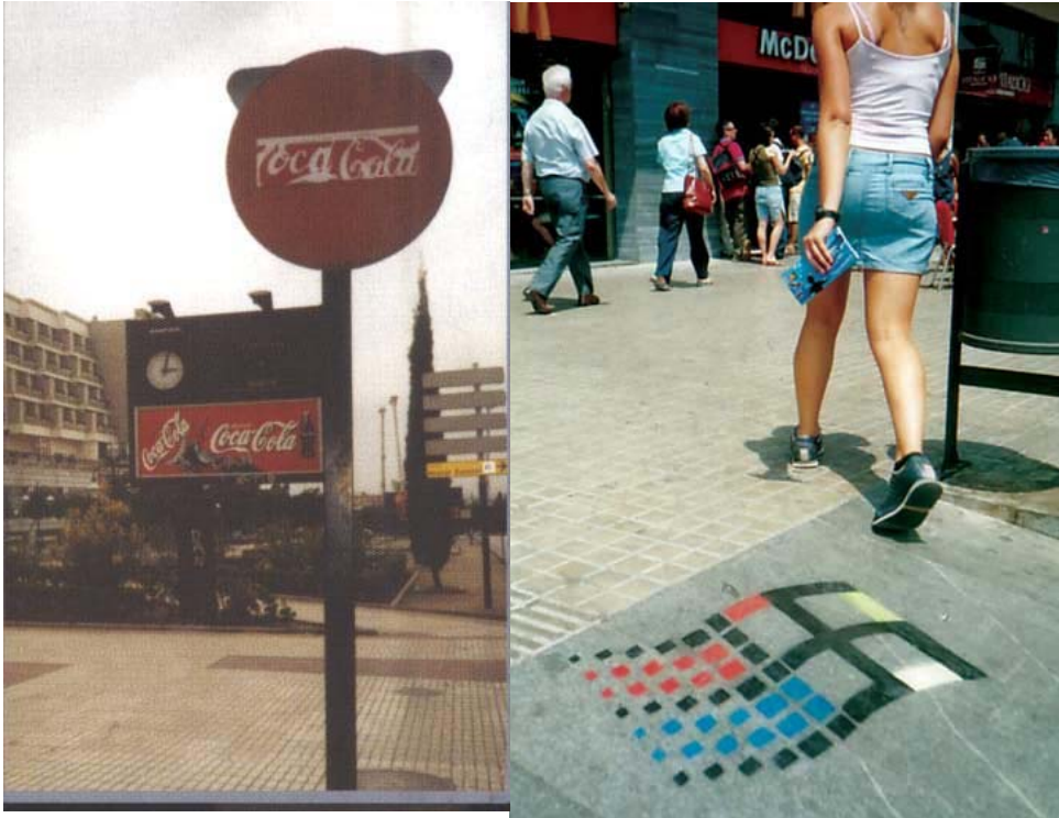
Plantillas de Coca-Cola y la ventana de Windows, SAM3

El último estilo de SAM3 que voy a describir, quizás su estilo más curioso, es el de los “barquitos sobre el decorado urbano.” Estos graffiti consisten de un barco velando por unas aguas. Son pintados de un estilo muy simplista, parecido a los dibujos de libros infantiles. Ellos son pintados sobre escenas urbanas, como paredes que tienen muchos tags, publicitarias, y otros planos donde suele mirar el público. Esas imágenes tan simples tienen una gran presencia cuando son puestos en lugares tan desparecidos a su contenido. Dice SAM3, “tienen el poder de la evocación, más que el de la representación en la crudeza de sus formas nos hablan de sus funciones básicas de comunicación...la pintura debería empezar a asesinar y a desprestigiar la sobredosis de imagen en la que nos encontramos, o por lo menos no adularla.” 8