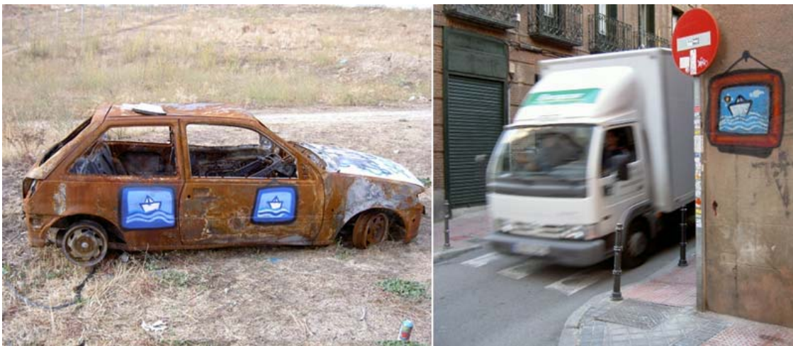
Barquitos sobre el decorado urbano, SAM3

Otro graffiti que ha llamado mucho de mi atención como imagen tan simple es el de un jirafa pintado sobre una pared y incluyendo cables eléctricos en su imagen. Esta imagen es divertida y hecha con mucha imaginación. Cada vez que paso por ella, pienso