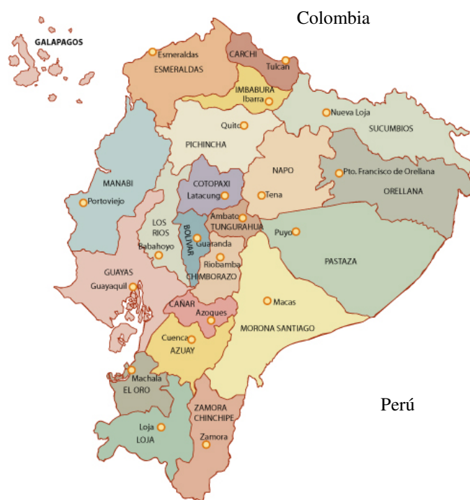
Fig. 1—Mapa de Ecuador. Las provincias australes de Azuay y Cañar tiene la migración más vieja en Ecuador y representa 14% de migración nacional.

La tercera oleada migratoria empezó a finales del siglo XX y representa un cambio radical en la migración ecuatoriana en términos de ritmo, género y destino. A causa del bajo precio del petróleo empezando en los años 80, el ritmo de inflación, desempleo, subempleo y pobreza en el país creció durante todos los 90. 4 Con una crisis financiera internacional y una crisis bancaria en el país, la economía de Ecuador colapsó completamente en 1998. 5 El colapso resultó en “el empobrecimiento más acelerado en la historia de América Latina,” con excepción del caso argentino en 2001—durante el periodo de 1997 a 1999 el porcentaje de casas que no podían cobrar las necesidades básicas creció de 37% a 47% y el desempleo creció de 9% a 15%.