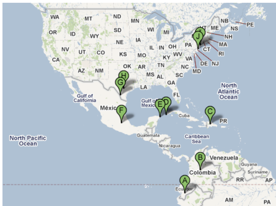
Fig. 2—Mapa del viaje de Vicente Yoza de Cuenca, Ecuador (A) a Nueva Jersey, EE.UU. (J). El viaje se demoró más de un mes y medio.

Por el tiempo y lo fuerte del viaje, afectó mucho a Yoza. “[Me sentí] muy preocupado, sufría mucho, lloraba mucho. Extrañaba mucho mi familia. A veces prefería haberme quedado [en Cuenca]...No con mucha comodidad ni mucho dinero pero si más tranquilo...[Pero] valía la pena...[El viaje me dio] la madurez para darme cuenta que es lo que quería.” Su intención en migración era ahorrar un capital suficiente para empezar una fabrica de muebles en Cuenca, y con esta meta en su mente el trabajaba fuertemente en los siguientes tres años. Al principio, el trabajo era duro—desde el día que el llegó a Nueva Jersey, trabajaba más de 12 horas diarias para pagar su deuda a su padre y hermanos. Sin conocimiento de los estándares de sueldos en los EE.UU., y con su deuda y condición irregular, el recibió poco dinero por su trabajo: “...me decían que iban a pagarme 80 dólares por día...Pero la realidad era que mi trabajo empezaba a las 6 de la mañana y regresábamos a la casa a las 11 de la noche, que era mucho abuso porque uno no sabía cuanto pagaba realmente.”