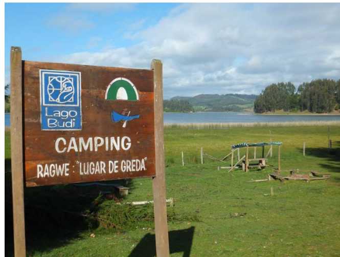
Figura 3: Sitio de Camping del Lago Budi (5 noviembre 2012)