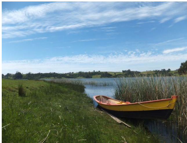
Figura 4: Paseo en bote por el Lago Budi (15 noviembre 2012)