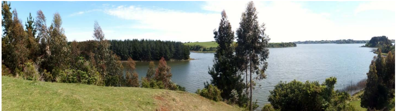
Figura 1: Panorámica del Lago Budi (18 octubre 2012)

Lago Budi, sombrío, pesada piedra oscura, agua entre grandes bosques insepulta, allí te abrías como puerta subterránea cerca del solitario mar del fin del mundo.