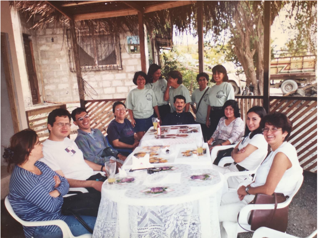
Grafico #2