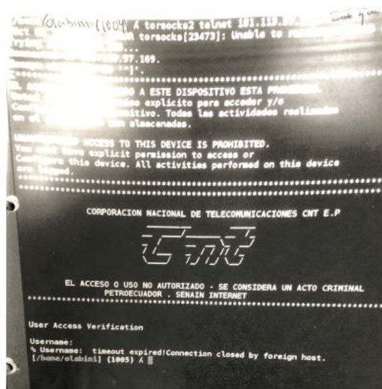
Figura 3: La captura de pantalla para evidencia

Sin embargo, revocar los derechos de asilo de Assange no fue suficiente para detener la protección de la libertad en Internet. Moreno también amplió su alcance al penalizar a los amigos de Assange, como el programador sueco Ola Bini. Horas después de que Assange fuera detenido en Londres, Ola Bini, un experto sueco en seguridad cibernética y defensor de la privacidad digital, fue detenido sin una orden judicial en el aeropuerto de Quito mientras volaba a Japón por la razón de haber atacado los sistemas informáticos de Ecuador. La fiscalía tenía evidencia de las conversaciones personales de Bini con Assange, sin embargo, no puede haber "culpa por asociación." 25 Además de esta evidencia, la policía recolectó todas sus computadoras portátiles personales, iPads, iPods, USB encriptados, tarjetas de crédito y otras posesiones. Debido a su apretada agenda de viajes y $ 230,000 gastados en servicios de internet, los fiscales afirmaron que debió haber cometido el ataque contra los sistemas ecuatorianos y, como afirma el presidente Moreno, visitó reiteradamente a Assange en la embajada ecuatoriana "probablemente para recibir instrucciones." La evidencia presentada fue la siguiente captura de pantalla que "probó" que ingresó ilegalmente a un enrutador de corporaciones nacionales de telecomunicaciones en 2015. 26